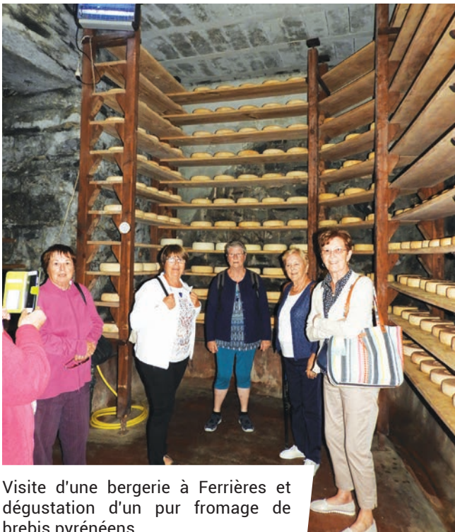
Visite d'une bergerie à Ferrières et dégustation d'un pur fromage de brebis pyrénéens