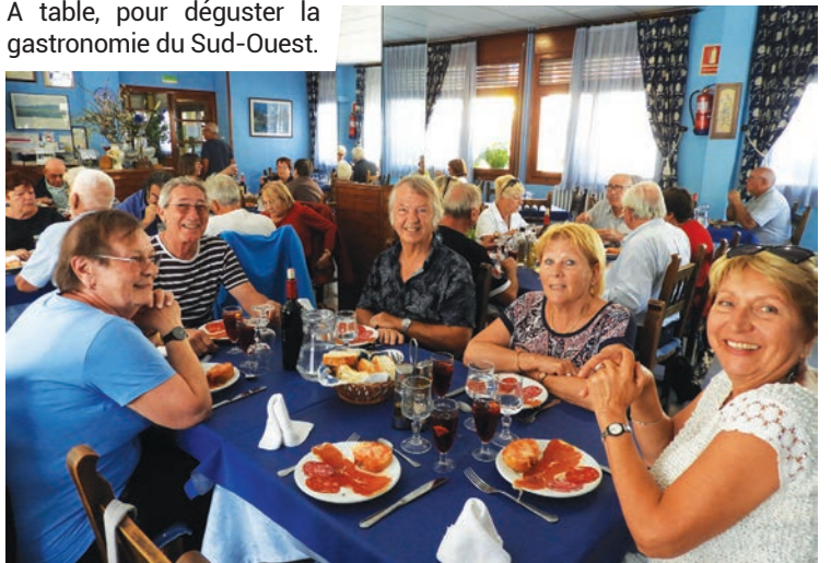
A table, pour déguster la gastronomie du Sud-Ouest.