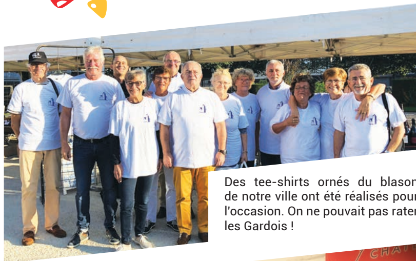
Des tee-shirts ornés du blason de notre ville ont été réalisés pour l'occasion. On ne pouvait pas rater les Gardois !