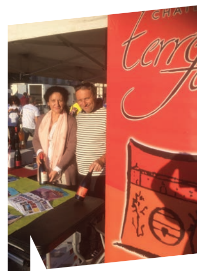
Présent depuis le début de ces rencontres rochefortaises, le Chateau Terre Forte a fait déguster sa production bio.

Un chez nous ? Une bonne idée ! On va le faire !