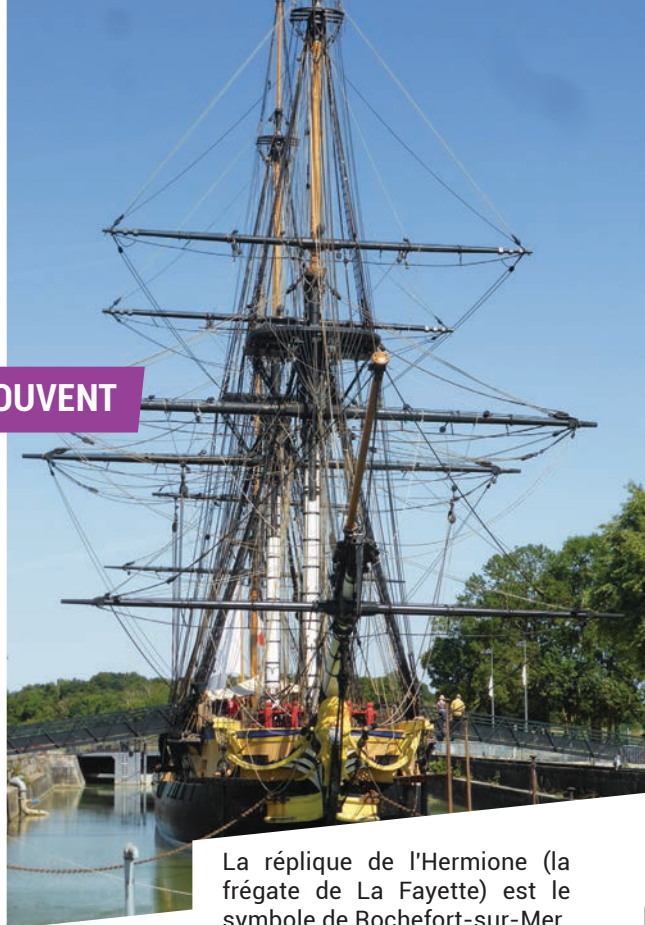
La réplique de l'Hermione (la frégate de La Fayette) est le symbole de Rochefort-sur-Mer.