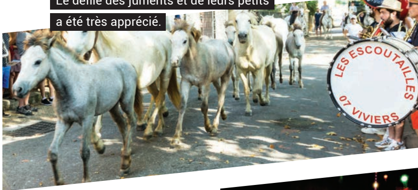
Le défilé des juments et de leurs petits a été très apprécié.

L'aïoli a été préparé avec soin par notre cuisine centrale et dégusté avec gourmandise, place de la Vote, par de nombreux convives.