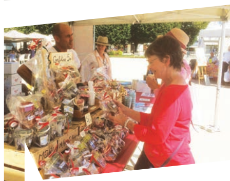
L'association la Jarre a présenté les produits typiquement rochefortais : huile d'olive et confitures